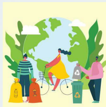
Insignia del módulo 6