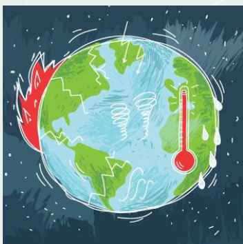
Insignia del módulo 1

Para superar el curso habrá que haber realizado con éxito los cuestionarios de evaluación de sus seis módulos (es decir, haber obtenido las cuatro insignias correspondientes) y un cuestionario final de evaluación del curso completo . El alumnado que supere el curso completo obtendrá una insignia que indicará esa circunstancia. A continuación, se muestran las insignias que podrán verse en el perfil de cada persona según se vayan obteniendo.