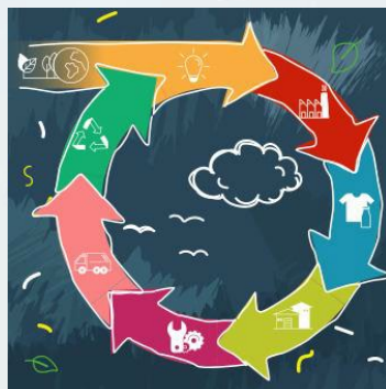
Insignia del módulo 5