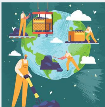
Insignia del módulo 2