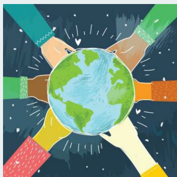
Insignia del módulo transversal