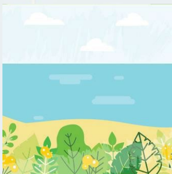
Insignia del módulo 4